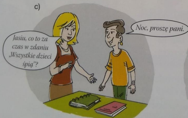
Na lekcji języka polskiego