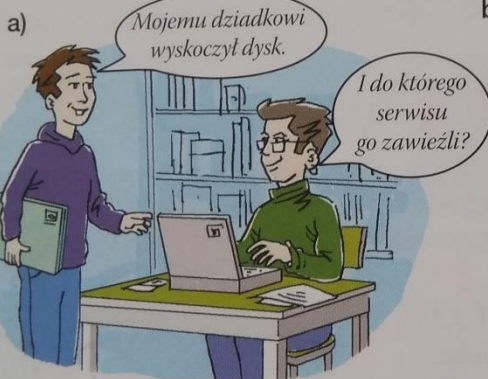
W pracowni komputerowej

3. Wskaż w przedstawionych dowcipach te wyrazy, które z powodu swojej wieloznaczności są źródłem komizmu.